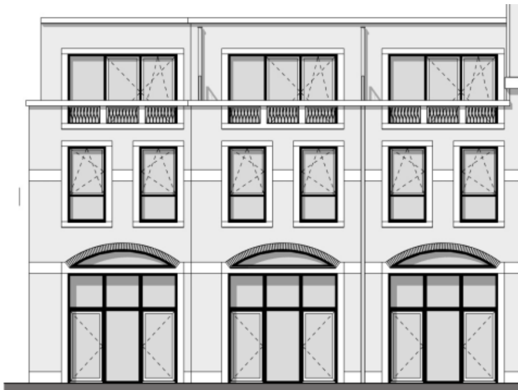
Gewijzigd gevelfragment oostgevel bouwnummers 32 t/m 34 (Oude Zijvest)

In de achtergevel is de enkele toegangsdeur in het midden gewijzigd naar twee toegangsdeuren, conform onderstaand fragment.